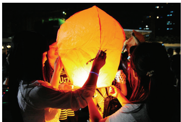
现场同学共同放飞孔明灯