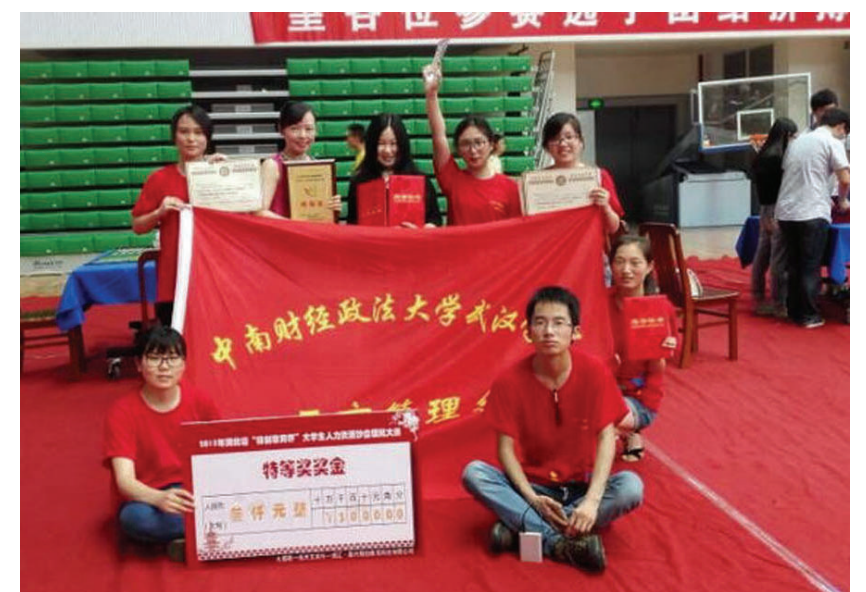
“武院队”在活动现合影留恋

“精创教育杯”湖北省人力资源沙盘大赛是面向全国普通全日制高校人力资源相关专业在校大学生的科技竞赛项目,是湖北省首届人力资源沙盘大赛,由湖北省人力资源学会、湖北省人力资源“政产学研”合作联盟、共青团湖北省委青年就业创业促进中心联合举办。