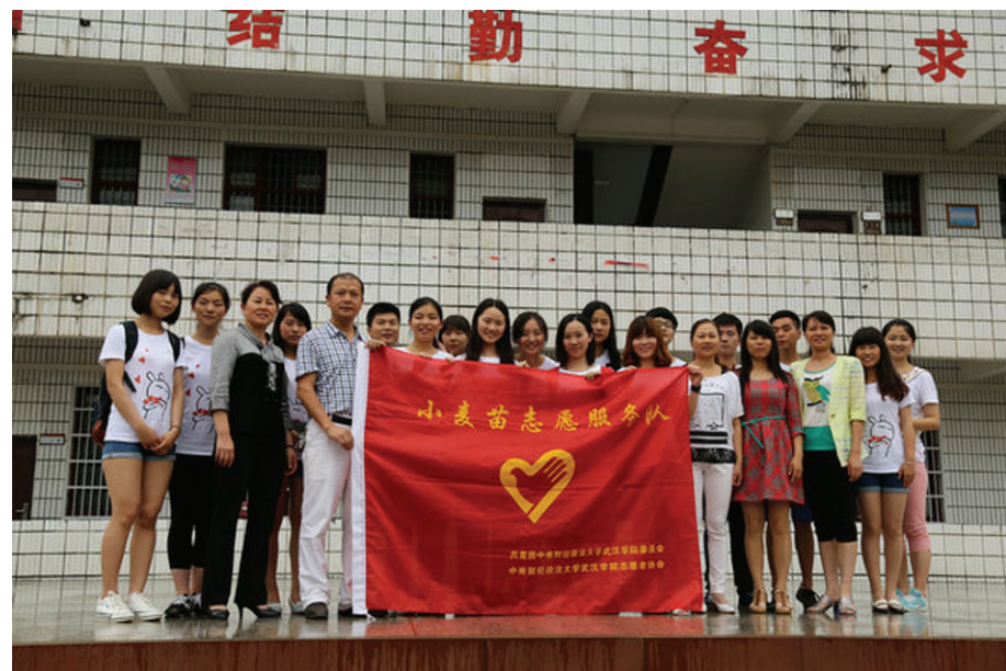
志愿者同学校老师合影

自去年11月我院团委在南林小学正式挂牌“暖阳计划实践教育基地”以来,不断拓展“暖阳计划”这一关爱山区留守儿童公益项目。已相继在孝感市大悟县雨岗小学开展过两次志愿服务活动并带去物资。“小麦苗”志愿服务队将在院团委的指导下更加深入开展关爱留守儿童关爱活动,为当代大学生树立一面追求在奉献中快乐成长进步进步的旗帜。