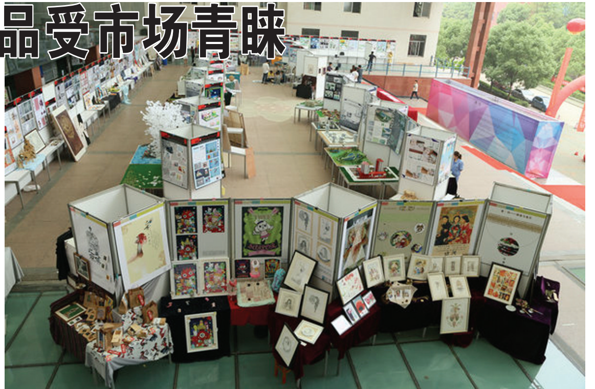
毕业现场全景

们艺术教学的课堂中,这些学生以高度的敏锐和机智向我们展现了内涵丰富的创作理念以及令人耳目一新的视觉体验。最终,这些作品作为最后的纪念展示在这里,既是对过去四年的总结,也是对未来的鞭策和鼓励。