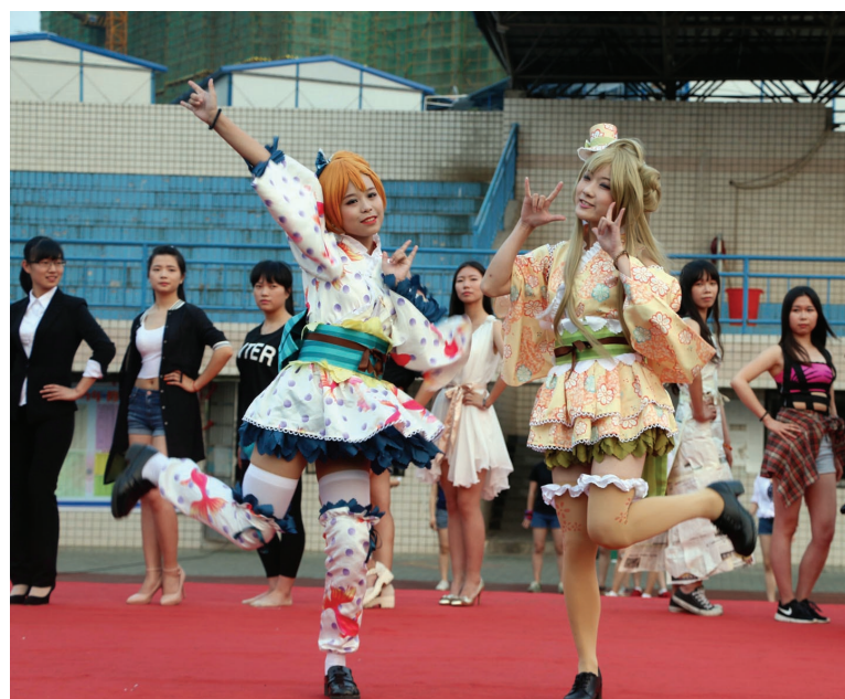
精彩表演吸引眼球

本报讯(通讯员 刘影)5月20日,由我院团委主办、社团联合会承办的首届社团文化节之园游会活动在大操场成功举办,此次活动共吸引了500多名学生共同参与。