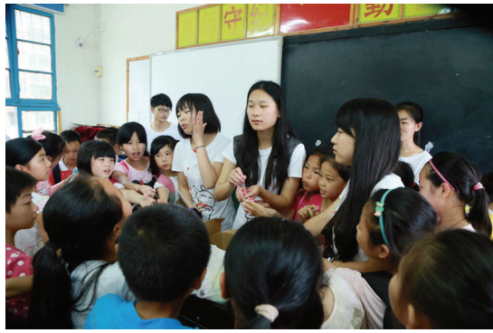
志愿者开展活动现场

本报讯(通讯员 翁胜兰)六一儿童节来临之际,我院小麦苗志愿服务队的志愿者们一行16人,满载爱心和希望前往湖北省通山县南林镇南林小学教育实践基地,开展“为山区留守儿童庆六一”志愿服务活动。