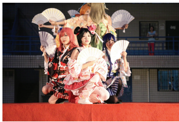
精彩表演吸引眼球