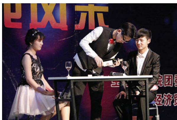
仿真场景环节

本报讯 5月21日晚,由经贸系和院团委联合举办的第四届礼仪风采大赛在大学生活动中心举行,武院学子在青春飞扬的比赛里表达他们对中国传统礼仪的热爱。