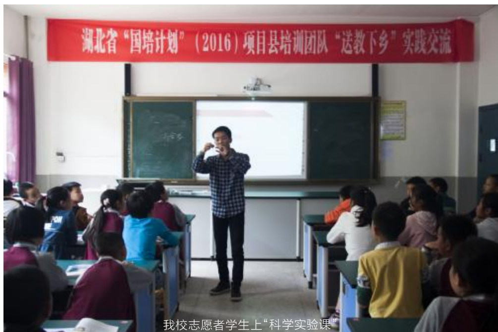
我校志愿者学生上“科学实验课”

活动结束后,志愿者们不断总结活动经验。在授课过程中,通过亲身实践感受到了演练和实战的差距。并深刻理解了“奉献、友爱、互助、进步”的志愿服务精神,用实际行动为社会奉献出自己的公益力量,深切感受到服务奉献的快乐。