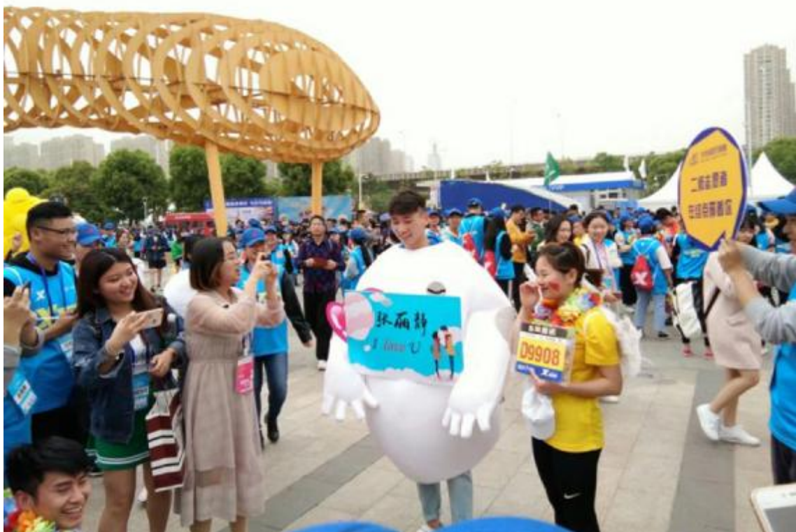
魏俊采访准备求婚的人